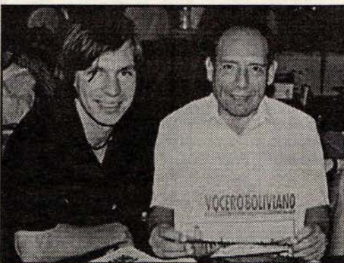
El cantante junto a su padre quién es su representante

Los proyectos de Derek se resumen en cinco palabras, tocar todo el tiempo posible. Y sobre todo poder actuar en Bolivia, país que lo vió nacer pero no crecer.