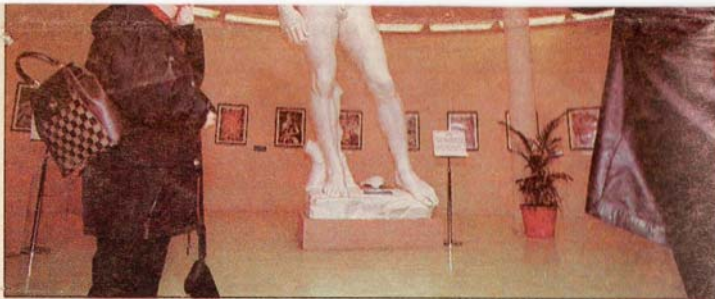
La galería de arte con réplicas de las obras de Miguel Angel: toda una novedad.

que permite al turista degustar un almuerzo o disfrutar un chocolate caliente mientras observa una amplia vista de 360 grados que alcanza al lago Nahuel Huapi casi completo, el cerro Tornador con sus tres picos, los lagos cercanos a Bariloche y el cordón de la cordillera.