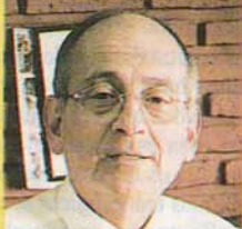
Memoria 1ª edición