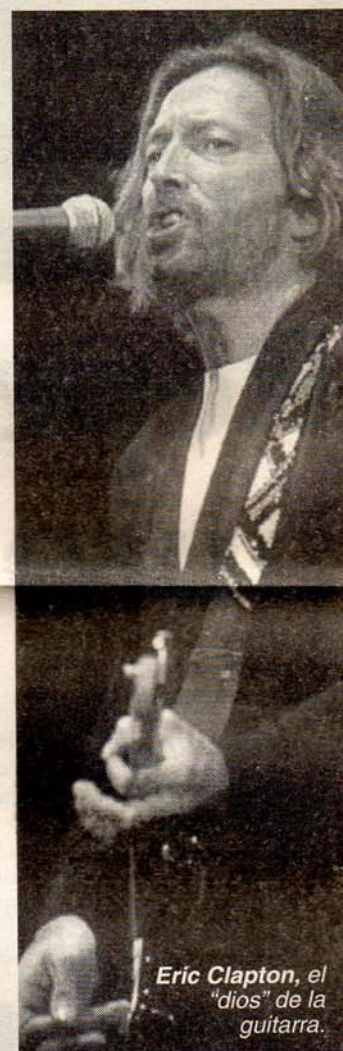
Eric Clapton, el "dios" de la guitarra.