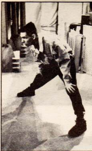
La escenografía no consigue atarlo, por lo tanto cualquier pose es válida para presentar 'clips'. Los músicos que se demuestran en los clips son incondicionales de "Clips".